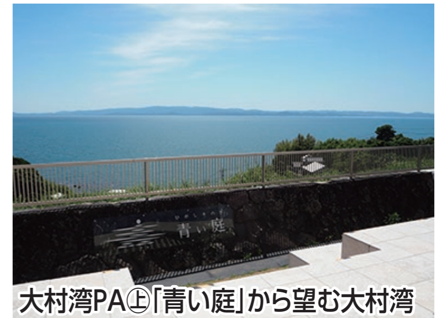
大村湾PA①「青い庭」から望む大村湾