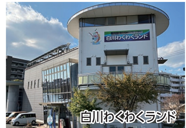
白川わくわくランド