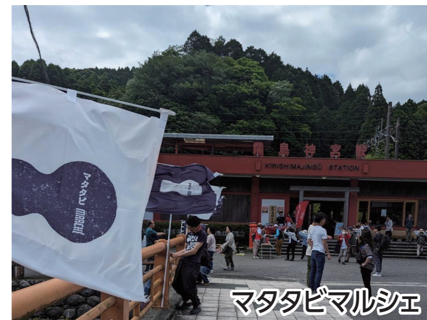
マタタビマルシェ