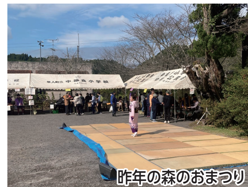
昨年の森のおまつり