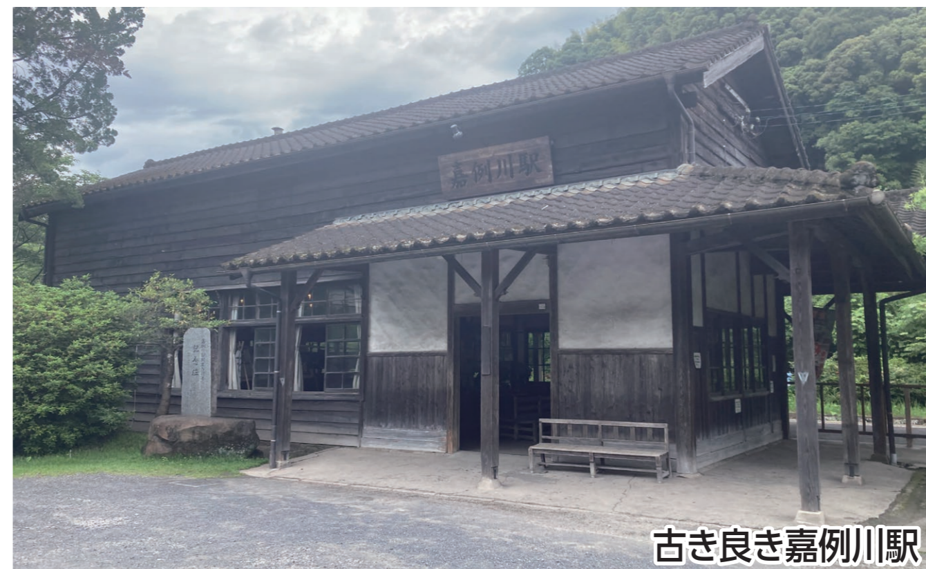
古き良き嘉例川駅

豊かな自然の中を歩き、ゴールの嘉例川駅では年に1度の「森のおまつり」をお楽しみいただけます。地元の方が中心となって作りあげたおまつりはアットホームで例年沢山のお客さまで賑わいます。