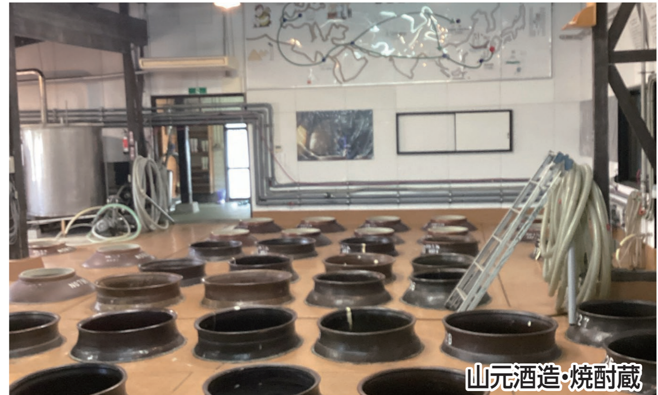
山元酒造・焼酎蔵

鹿児島県北西部に位置し海と山に囲まれ、市の中心部を九州三大河川、川内川が流れている薩摩川内市。川内駅をスタートし、川内川を抜け、大正元年創業の山元酒造へ。百有余年にわたって拘った焼酎をぜひ堪能してください。