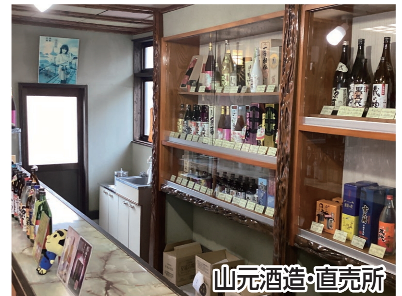
山元酒造・直売所