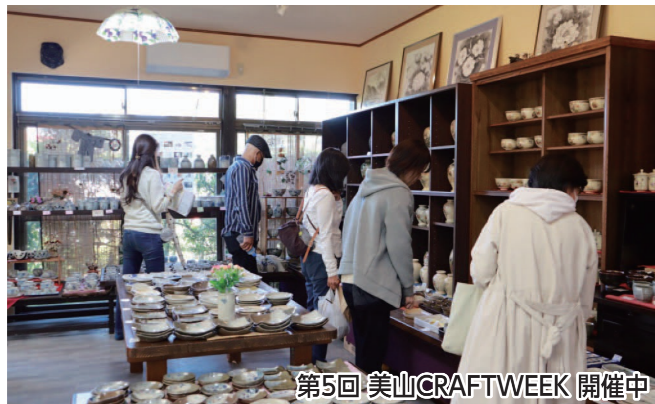
第5回 美山CRAFTWEEK 開催中

美山を見て、歩いて、味わって。「薩摩焼の里」美山で、芸術の秋を楽しむコースです。また、伊集院町徳重にある神社巡りやカフェで一息入れるコースです。