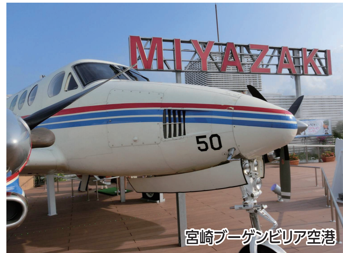
宮崎ブーゲンビリア空港