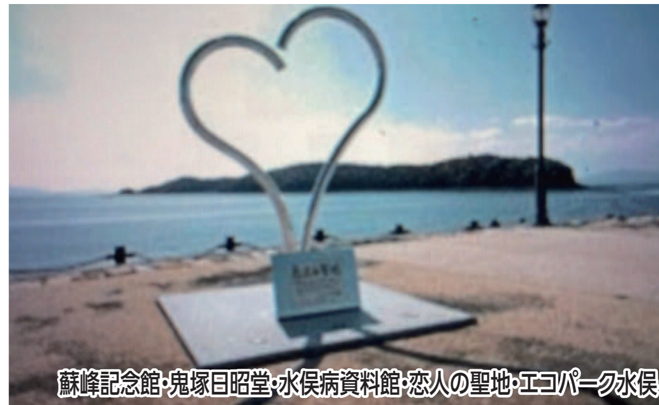
蘇峰記念館・鬼塚目昭堂・水俣病資料館・恋人の聖地・エコパーク水俣