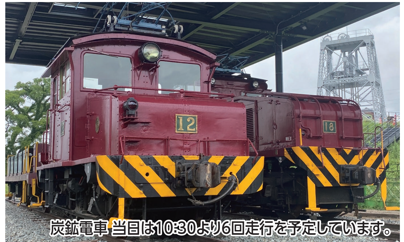
炭鉱電車 当日は10:30より6回走行を予定しています。

宮崎兄弟の生家や秋バラが綺麗なおもやい市民花壇でバラを満喫し、世界文化遺産の「万田坑」では、昨年より一般公開が始まった「炭鉱電車」や万田坑新エリアの見学を楽しむことができます。