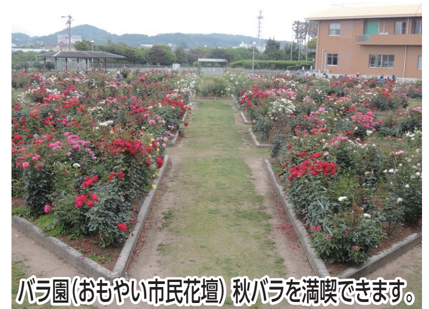
バラ園(おもやい市民花壇) 秋バラを満喫できます。