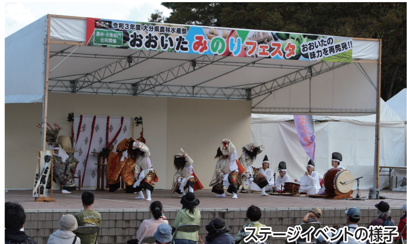
ステージイベントの様子