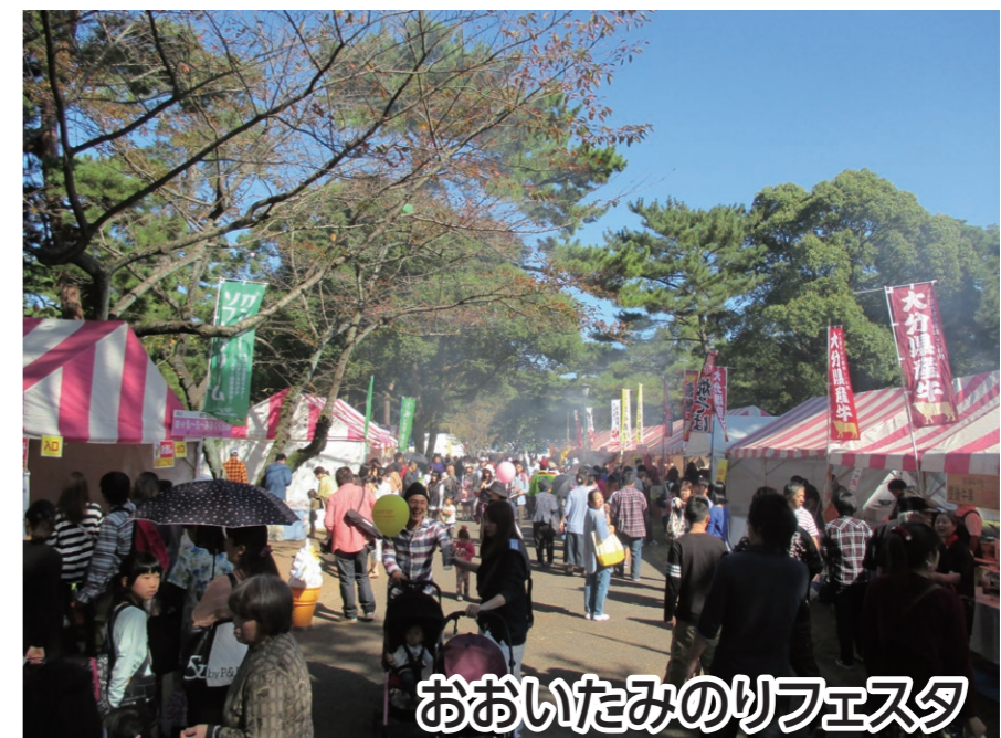
おおいたみのりフェスタ