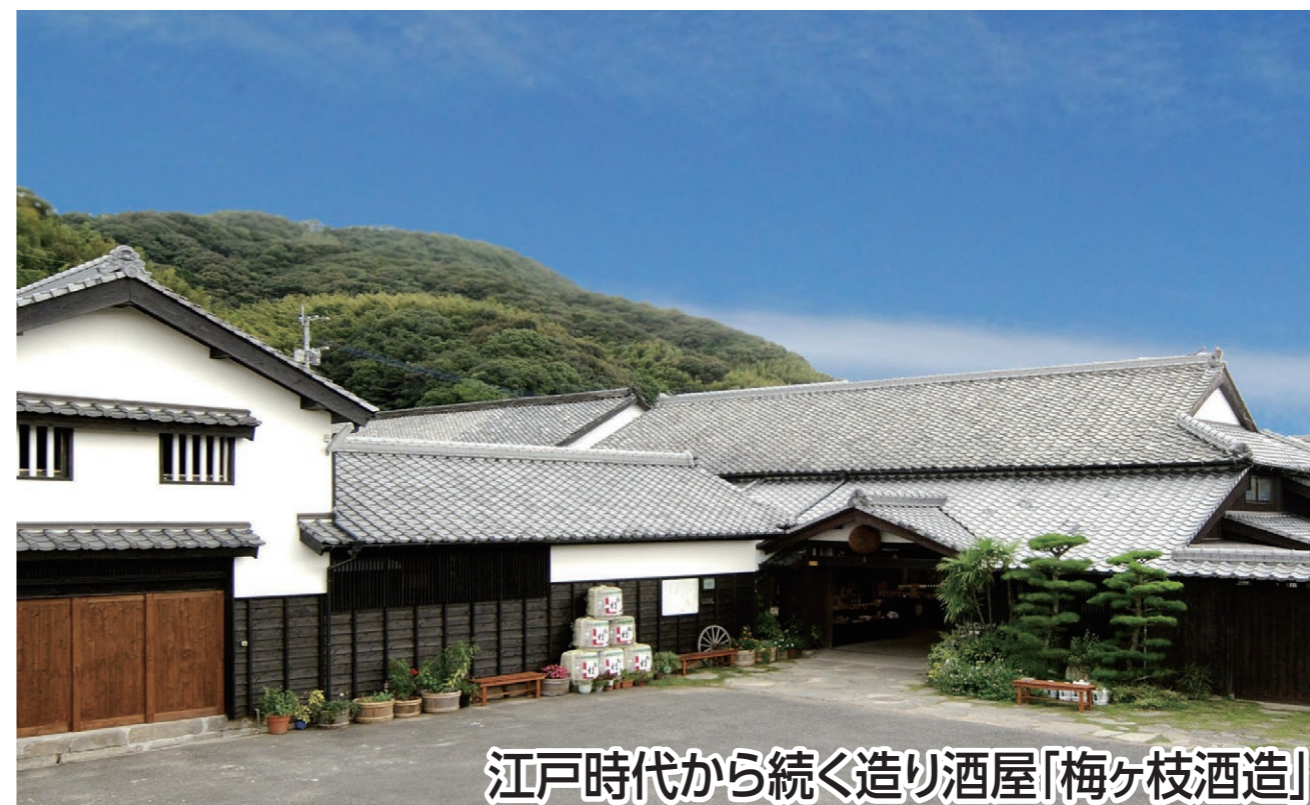
江戸時代から続く造り酒屋「梅ヶ枝酒造」

日本遺産「無窮洞」や宮地区の史跡を巡ります。「梅ヶ枝酒造」は秋の蔵開きが開催中で試飲や蔵の見学が楽しめます。華やかでフルーティーな香りが特徴の芋焼酎、日本酒の新酒、ウイスキーの限定販売もごさいます。