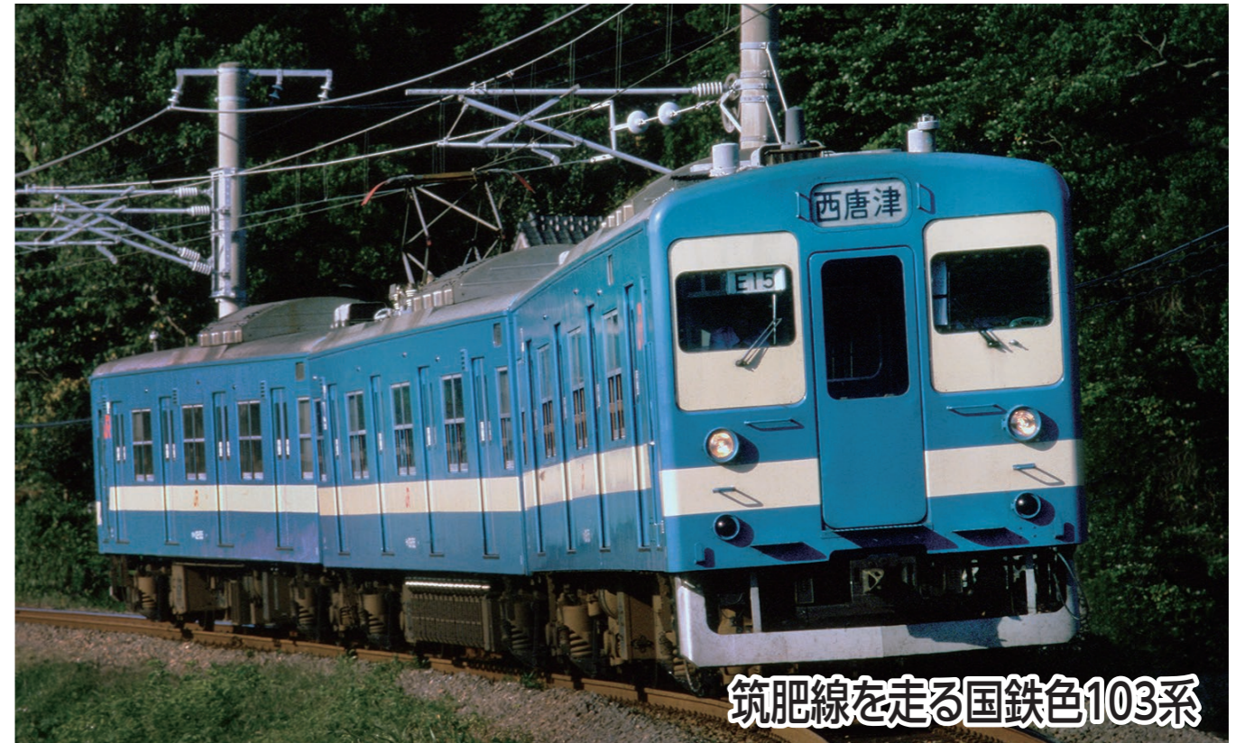
筑肥線を走る国鉄色103系

筑肥線(筑前前原～虹ノ松原)は今年で100周年を迎えました!その虹ノ松原駅をスタートし、松浦川や唐津城の景色をお楽しみいただけるコースです。また途中の東唐津駅では、記念パネルを展示予定です!