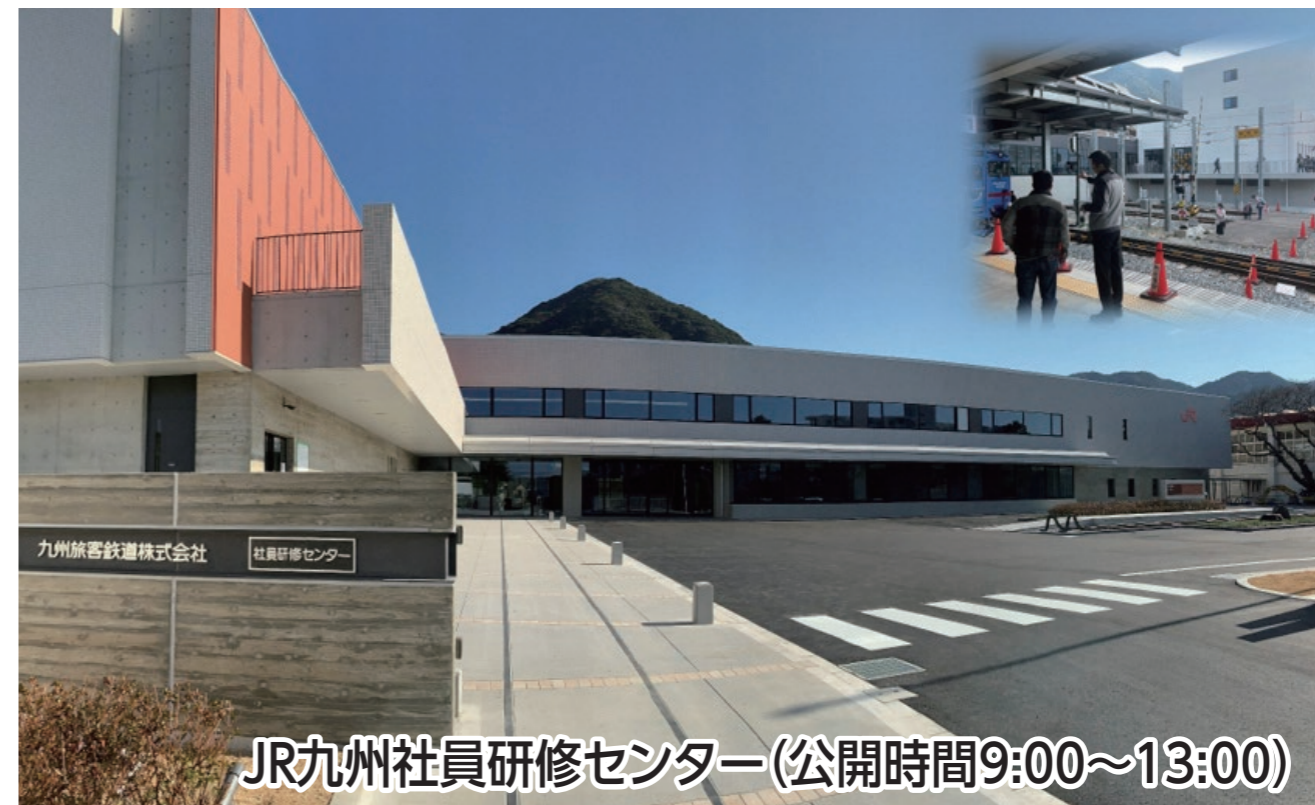
JR九州社員研修センター(公開時間9:00~13:00)