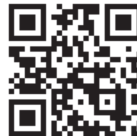
うきは観光みらいづくり公社HP