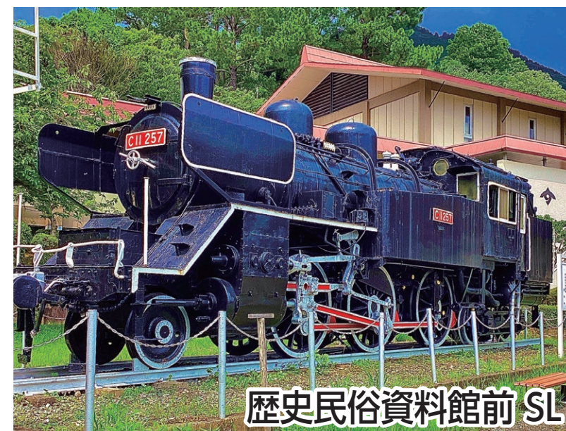
歴史民俗資料館前 SL