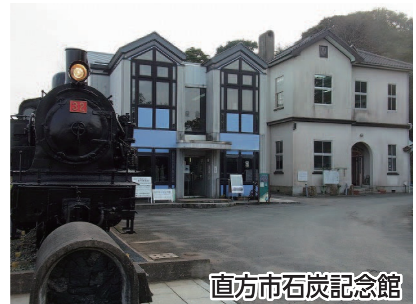
直方市石炭記念館