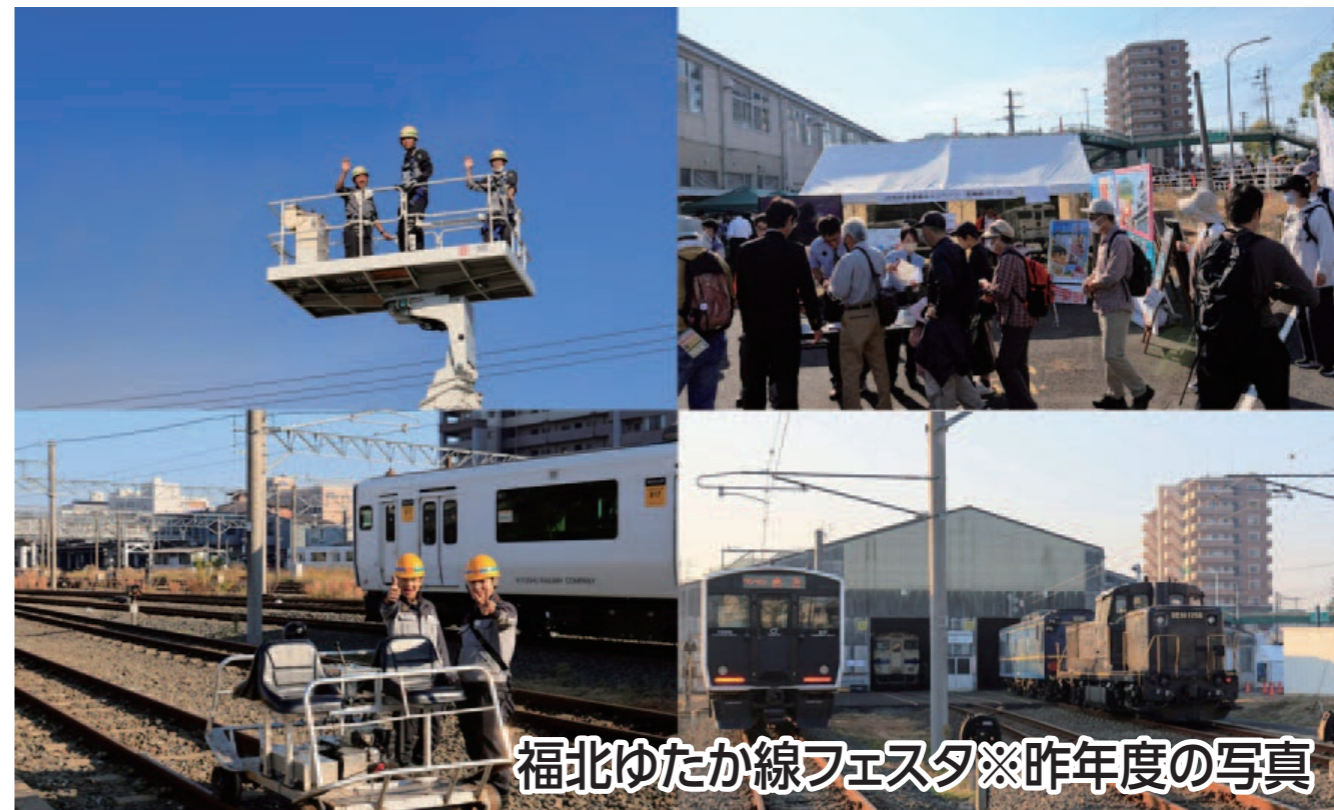
福北ゆたか線フェスタ※昨年度の写真

石炭産業と鉄道のまち「のおがた」でどこか 懐かしい商店街を巡り、当日開催される「福 北ゆたか線フェスタ」も一緒に楽しんでみ ませんか?