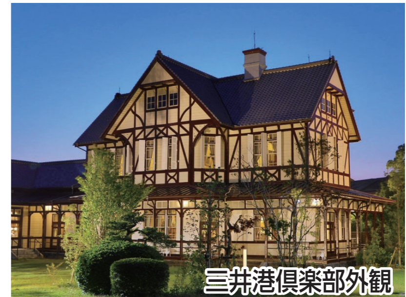
三井港倶楽部外観