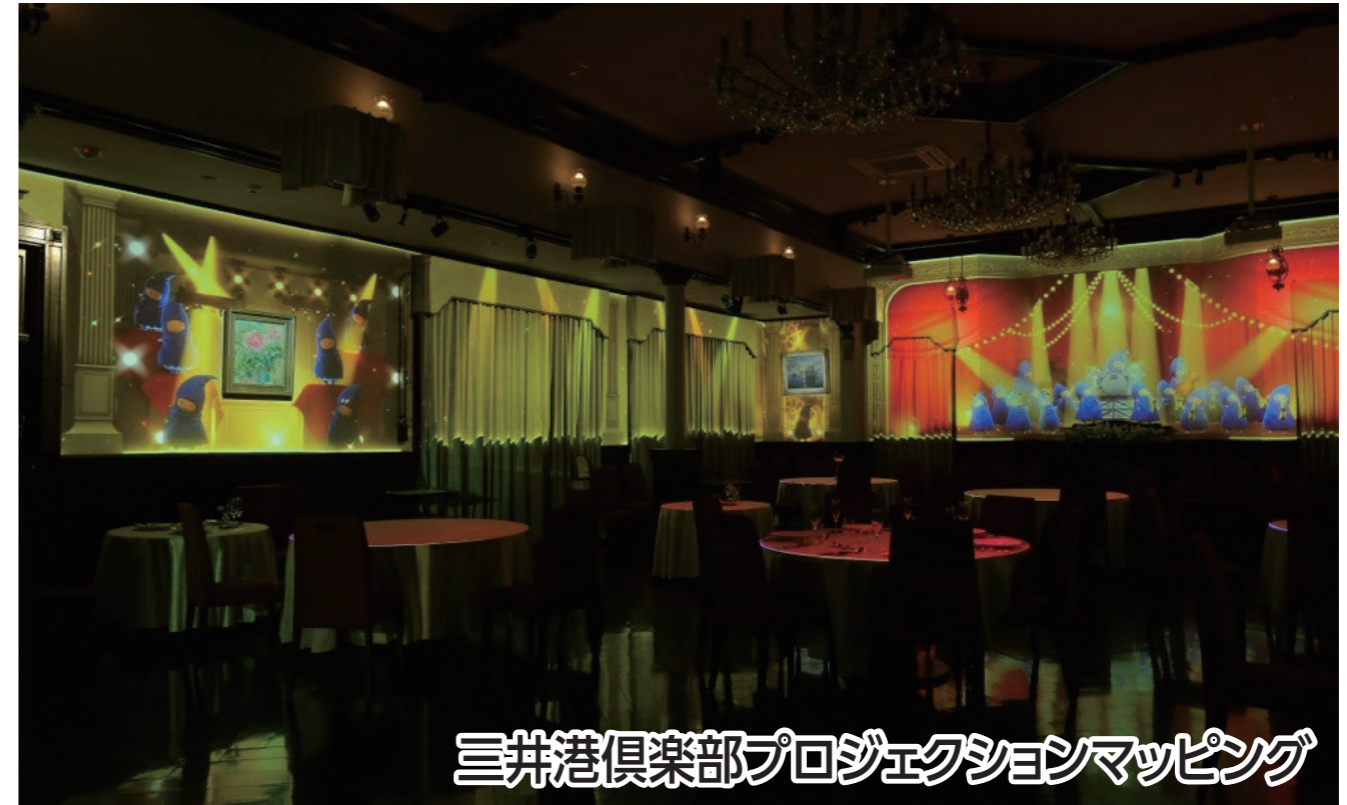
三井港倶楽部プロジェクションマッピング

三井港倶楽部では、5月から始まったプロジェクションマッピングを参加者に公開します。三井港倶楽部の敷地から入場できる三川坑跡や国登録有形文化財の大牟田市庁舎では公開イベントも開催!大牟田の見どころが沢山のコースです。三井港倶楽部では先着100名様にお得な特典アリ!