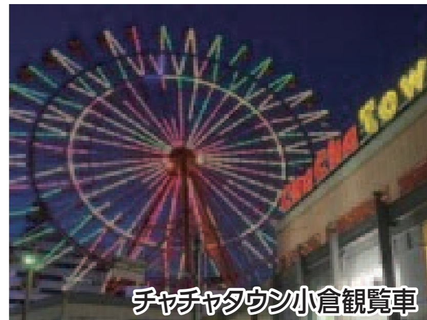
チャチャタウン小倉観覧車