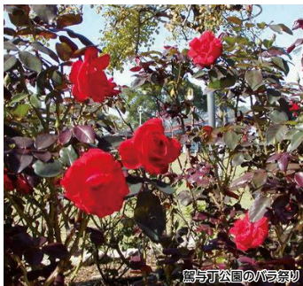
駕与丁公園のバラ祭り

駕与丁公園の約4kmの周回コース沿いには、新緑の木々があり、ジョギングや自然を楽しむ散歩やピクニックの場として親しまれています。