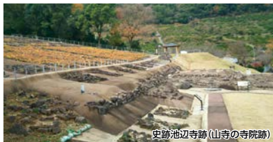
史跡池辺寺跡(山寺の寺院跡)

西南の役で薩軍が本営とした「北岡神社」、建立され1,200年以上の歴史を持つ「清水寺・長谷寺」、国指定史跡の池辺寺(ちへんじ)跡を巡ります。