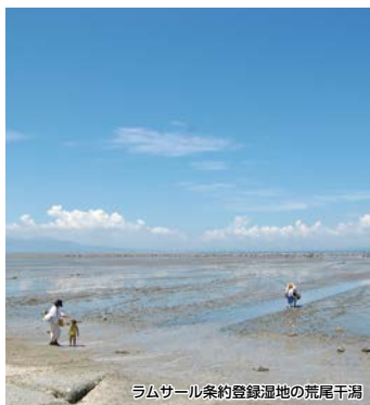
ラムサール条約登録湿地の荒尾干潟

渡り鳥の生息地としてラムサール条約湿地に登録された荒尾干潟と、多数のイベントが開催される火の国長洲金魚まつりで子供から大人まで楽しんでいただけるコースです。