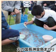
火の国長洲金魚まつり