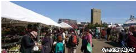
くまもと春の植木市

およそ400年続く花と緑の大祭「くまもと春の植木市」や、「新町」などのレトロな城下町、そして“日本三大名城”の1つ「熊本城」をめぐる。また、「桜の馬場 城彩苑」ではお食事やお土産をご堪能ください。