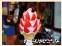
オニ盛いちごソフト