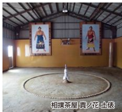
相撲茶屋「貴ノ花」土俵

相撲茶屋貴ノ花で土俵を見学した後、三井寺に立ち寄り後藤寺商店街を抜け、ゴールの田川後藤寺駅を目指すコースです。ゴール受付は、後藤寺商店街で行います。