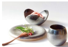
日常に華を添える上野焼の器たち

福智スイーツ大茶会 (10:00~16:00) 「食」「器」「音楽」の出会いをテーマに50店舗を超える県内有名スイーツ店が一堂に会す福智のシンボルイベント。絶品グルメや上野焼とのコラボ企画も盛りだくさん! ※平成筑豊鉄道主催 へいちくフェスタ同時開催 ※スタート、ゴール受付時間を変更しています。