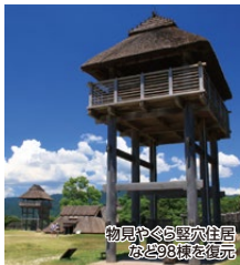
物見やぐら堅穴住居 など98棟を復元

秋の吉野ヶ里歴史公園内では、弥生時代の景色の中、紅白のそばの花が見頃を迎えます。