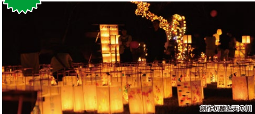
創作灯籠と天の川

高鍋の歴史と情緒あふれる灯籠まつり。駅から会場に向け徐々に暗くなっていく街並みを見ながら、灯籠の風情をご堪能ください。