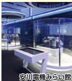
安川電機みらい館