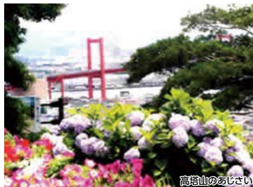
高塔山のあじさい

若松南海岸通りの大正期の建造物を散策しながら、石炭産業最盛期の史料館を見学して、県内でも有数のあじさいが咲き誇る高塔山山頂へ。若戸大橋、北九州市を一望して若松駅へ向かうコースです。