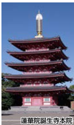
蓮華院誕生寺本院