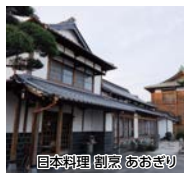
日本料理 割烹 あおぎり