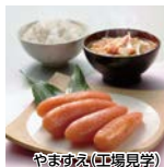
やますえ(工場見学)