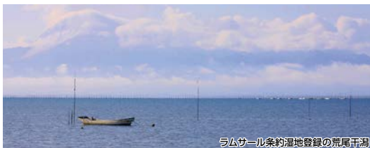
ラムサール条約湿地登録の荒尾干潟

渡り鳥の生息地としてラムサール条約湿地に登録された荒尾干潟と、多数のイベントが開催される火の国長洲金魚まつりで子供から大人まで楽しんでいただけるコースです。