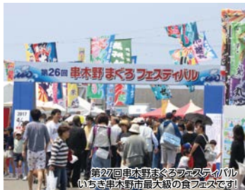
第27回串木野まぐろフェスティバル いちき串木野市最大級の食フェスです!

遠洋漁業の街「串木野」で鮪づくしのイベント「串木野まぐろフェスティバル」を開催。いちき串木野市で新鮮な魚に舌鼓しませんか?東シナ海の絶景をご覧ください、地元人気酒蔵で美酒を堪能しましょう!