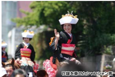
花嫁を乗せたシャンシャン馬

鹿児島県下三大祭りの一つである志布志お釈迦まつりや伝統のある大慈寺、宝満寺等を巡りながら散策し、歴史を感じることが出来るコースです! イベントやパレード・踊り連・花嫁を乗せたシャンシャン馬は必見です!