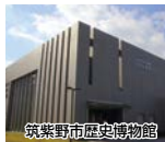
筑紫野市歴史博物館

九州最古の寺・ 武蔵寺の「長者の藤」 樹齢約1,300年と伝わる「長者の藤」はこの時期に見ごろを迎えます。棚から地面に届くほどの見事な「藤」をご鑑賞ください。