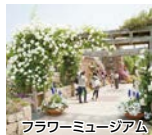
フラワーミュージアム