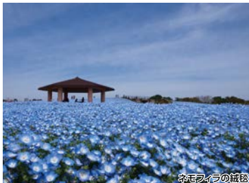
ネモフィラの絨毯

海の中道海浜公園、春の無料開放日に併せて開催です!春色の明るいお花が見ごろを迎えるこの季節、チューリップ・ポピー・ルミナスや150万本のネモフィラの絨毯があなたをお待ちしています。