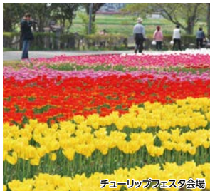
チューリップフェスタ会場

マイナスイオン全開の原尻の滝や、約40万本のチューリップが咲き誇るチューリップフェスタで、うらかな春を満喫!地元酒蔵での試飲サービスや、緒方駅前での物販などおもてなしを多数ご用意してお待ちしています!