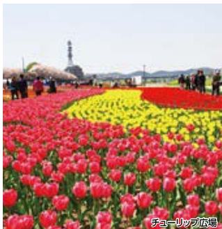
チューリップ広場

遠賀川河川敷で開催される、のおがたチューリップフェアで、咲き乱れるチューリップを満喫していただいた後は、直方レトロ街をゆっくりご覧ください。