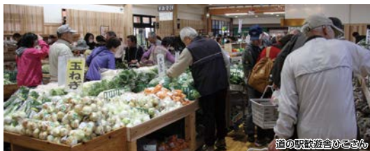
道の駅歓遊舎ひこさん

めんべい祭りが開催される「福太郎添田町めんべい工場」を通るルートです。桜いっぱいの添田公園を満喫できます。