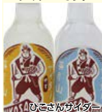
ひこさんサイダー