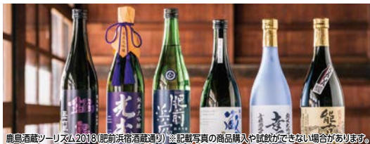
鹿島酒蔵ツーリズム2018(肥前浜宿酒蔵通り) ※記載写真の商品購入や試飲ができません場合があります。

肥前浜宿酒蔵を巡り、その酒が生まれた生地を散策しながら、歴史文化をご堪能ください。