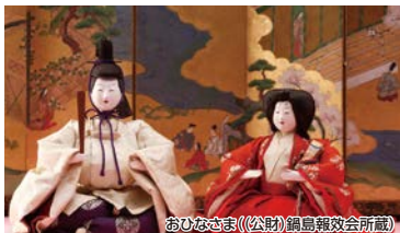
おひなさま((公財)鍋島報效会所蔵)

佐賀に春の訪れを告げる佐賀城下ひなまつり。過去から現在に伝わる職人技・食文化・佐賀の偉人たちの軌跡をご覧ください。最後はひなまつり会場の愛らしいおひなさまたちが、皆様をお出迎えます。