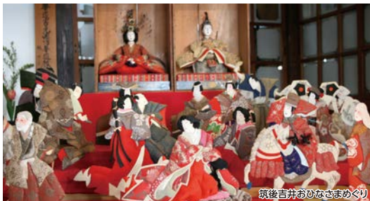
筑後吉井おひなさまめぐり

白壁の街に春を告げる「筑後吉井おひなさまめぐり」と毎年2月11日に開催される「いそのさわ蔵開き」の両方を楽しめるコースです。