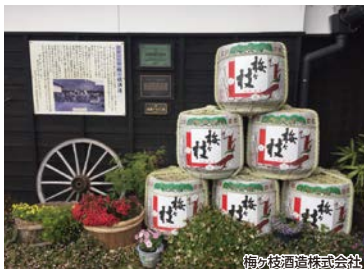
梅ヶ枝酒造株式会社

2月は毎年恒例の梅ヶ枝蔵開きが開催されます。当日は豚粕汁のふるまい、酒蔵コンサート、大道芸のパフォーマンス、蔵開き限定新酒、お楽しみ抽選会などイベント盛りだくさんの梅ヶ枝酒造へ、お越しください。