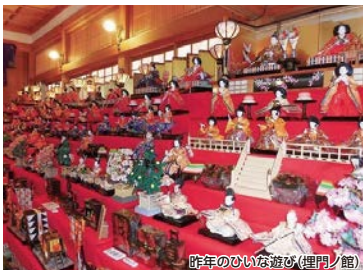
昨年のひいな遊び(埋門ノ館)

今年は昨年4月にオープンした唐津の新名所、旧大島邸にて雛人形が展示されます。唐津の歴史と近代化の両方が楽しめるコースとなっております。