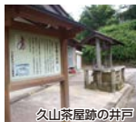
久山茶屋跡の井戸 坂本龍馬も飲んだといわれる井戸