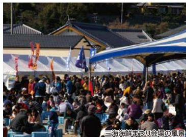
三海海鮮まつり会場の風景

幕末の志士坂本龍馬も歩いた「長崎街道」を中心に、春の訪れと歴史ある道を歩いていただきます。「さやごぜん」や「お馬の水」など、江戸時代にまつわる史跡が数多く残っており、当時の様子を感じながら歩いてみませんか。