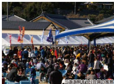
三海海鮮まつり会場の風景

幕末の志士坂本龍馬も歩いた「長崎街道」を中心に、春の訪れと歴史ある道を歩いていただきます。「さやごぜん」や「お馬の水」など、江戸時代にまつわる史跡が数多く残っており、当時の様子を感じながら歩いてみませんか。