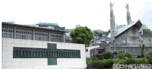
日本二十六聖人記念館

浦上駅をスタートし、聖人が歩いた「浦上街道」を歩き西坂の日本二十六聖人記念館へと向かいます。潜伏キリシタンの始まりである長崎の信仰の歴史を感じてください。