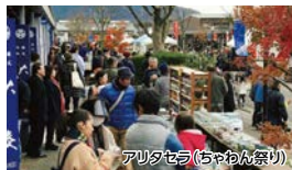
アリタセラ(ちゃん祭り)

町を彩る紅葉や陶磁器巡りなど、のんびりゆっくり「秋の有田」を感じることができるコースです。「ちゃん祭り」会場ではたくさんのイベントを開催しており、秋の有田をさらに盛り上げます。