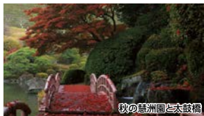
秋の慧洲園と太鼓橋

武雄温泉駅より武雄市役所新庁舎をたずね、武雄の物産まつりを巡ります。今回は、陽光美術館・慧洲園を無料にて拝観できる特典つきです。庭園内で秋の武雄を存分にご堪能ください。