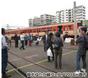
福北ゆたか線フェスタ2018in直方

直方駅前の商店街で開催される、直方産業祭りをご覧頂いた後は、直方レトロ街を散策し、鉄道のお祭り「福北ゆたか線フェスタ2018in直方」をお楽しみください。