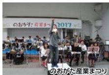
のおがた産業まつり