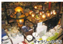
ギャラリーのぐち