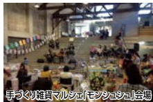
手づくり雑貨マルシェ「モンシュシュ」会場