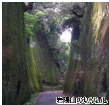
岩隈山の切り通し